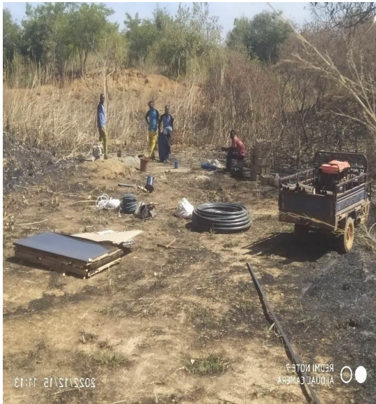
Matériel de plonge et plaques solaires