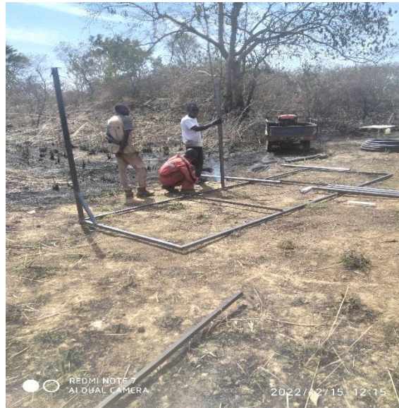
Confection de support du polytank

Nous avons eu recours à un plombier pour l'achat de la pompe hybride (fonctionnant sur le solaire et sur les 220 V) et de tous les accessoires indispensables au pompage d'eau